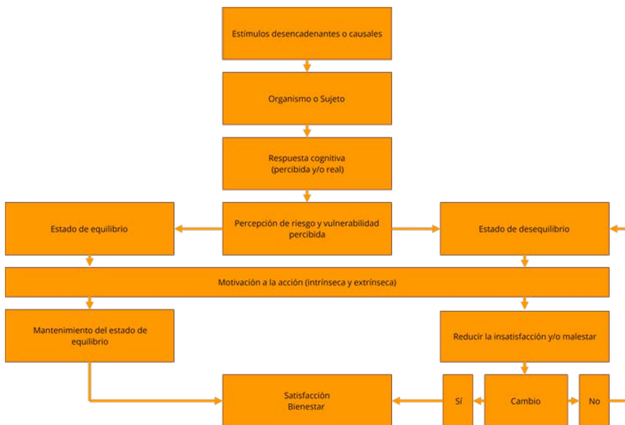
Figura 1. Concepto teórico del ciclo motivacional del comportamiento de salud

La puesta en funcionamiento del ciclo motivacional en los comportamientos de salud estaría conformada tal y como se ilustra en la Figura 1.