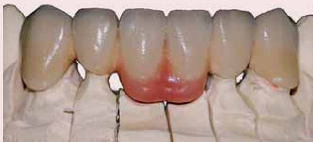
Fig. 1 – Prótese Parcial Fixa efectuada em aulas clínicas de Prostodontia Fixa na Clínica Universitária da UCP-CRB

A reabilitação oral em Prostodontia Fixa tem por objectivo proporcionar o restabelecimento das funções mastigatória, fonética e estética do paciente. Como estas reabilitações implicam processos morosos e geram grandes expectativas para o paciente, é importante para o Médico Dentista verificar se o esforço e gastos dispendidos correspondem efectivamente a essas expectativas.